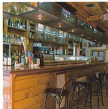
BAR AIDA T. 607 765 465 PINCHOS DE LA REGIÓN. ABIERTO DESDE LAS 7:00H.