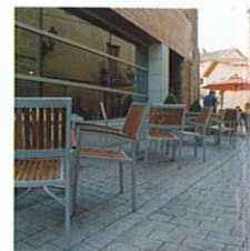
BAR EL OLIVAR T. 945 606 602 PICOTEO, CAFÉ Y COPAS