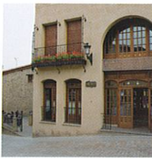
BAR BERRI T. 945 606 691 DE PINTXOS POR EL DÍA, DE COPAS POR LA NOCHE

BAR 1583 T. 635 719 061 DEL CROISSANT AL GIN-TONIC