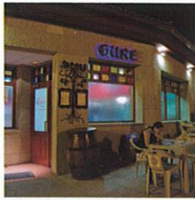
BAR GURE T. 945 606 406 AMBIENTE DE NOCHE Y RACIONES DE DÍA

T. 616 228 251 VENTA, DEGUSTACIÓN DE VINO, ACEITE Y PRODUCTOS TÍPICOS DE LA ZONA