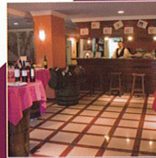
RESTAURANTE EL MESÓN DE ELIEGO T. 945 606 597 GRUPOS, CELEBRACIONES Y PLACER A LA CARTA